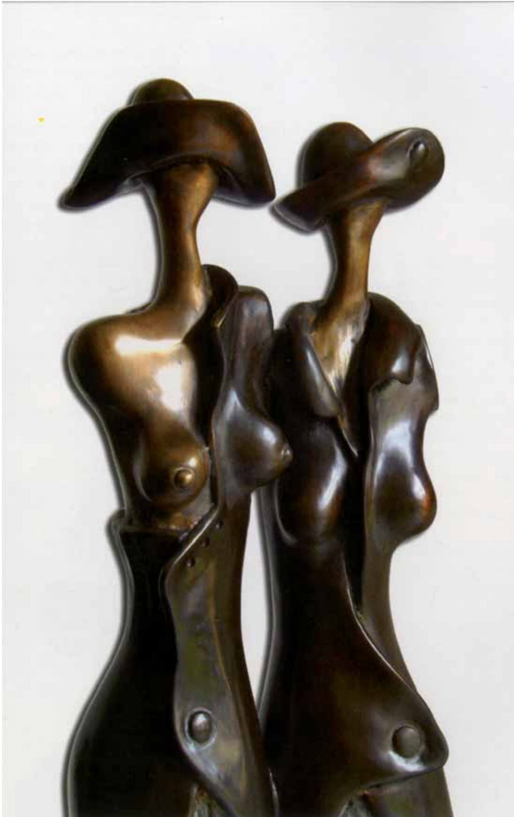
„Przyjaciółki”, brąz, 90 x 32 cm., 2008