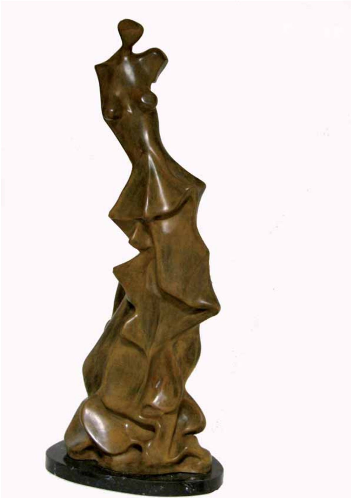
„Alba”, brąz, 85 x 35 cm., 2008