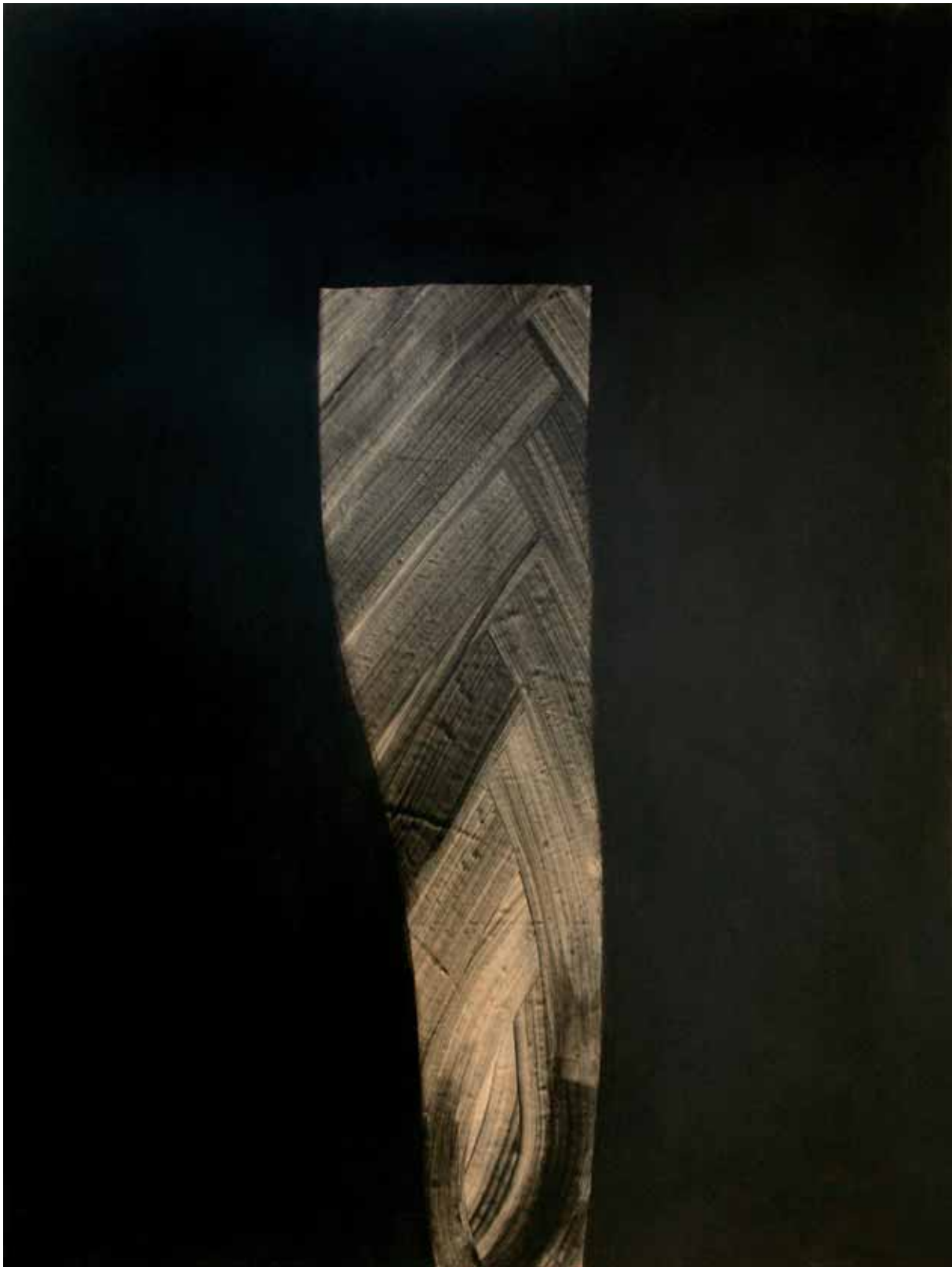
„Czerń I”, czarny pigment na papierze, 200 x 147 cm., 2008