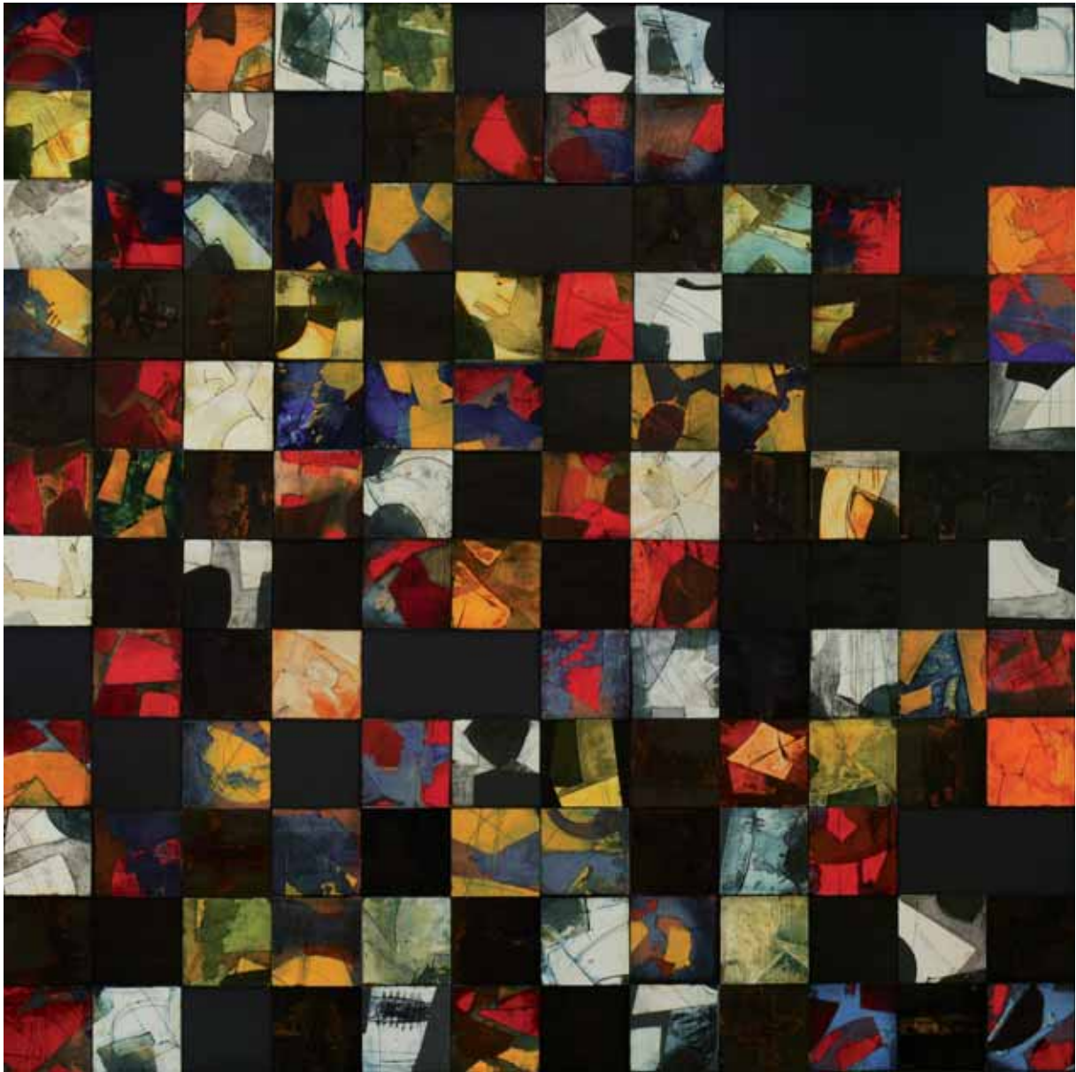
Bez tytułu, technika mieszana na sklejce, 180 x 180 cm., 2008