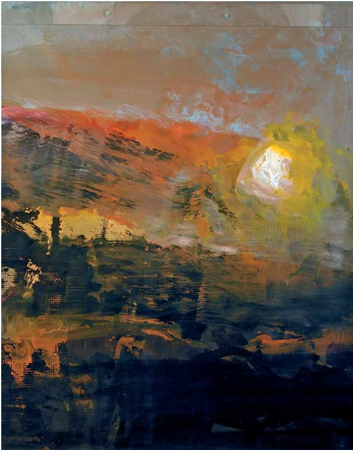
„Szmaty N° 3”, emalia na płótnie, 200 x 167 cm., 2006