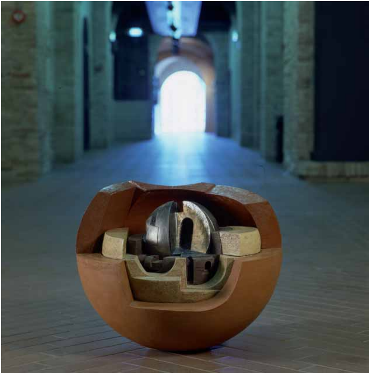
„Kula - Idealne Miasto”, kolorowa glina ogniotrwała z częścią centralną, diam. 65 cm., 1992