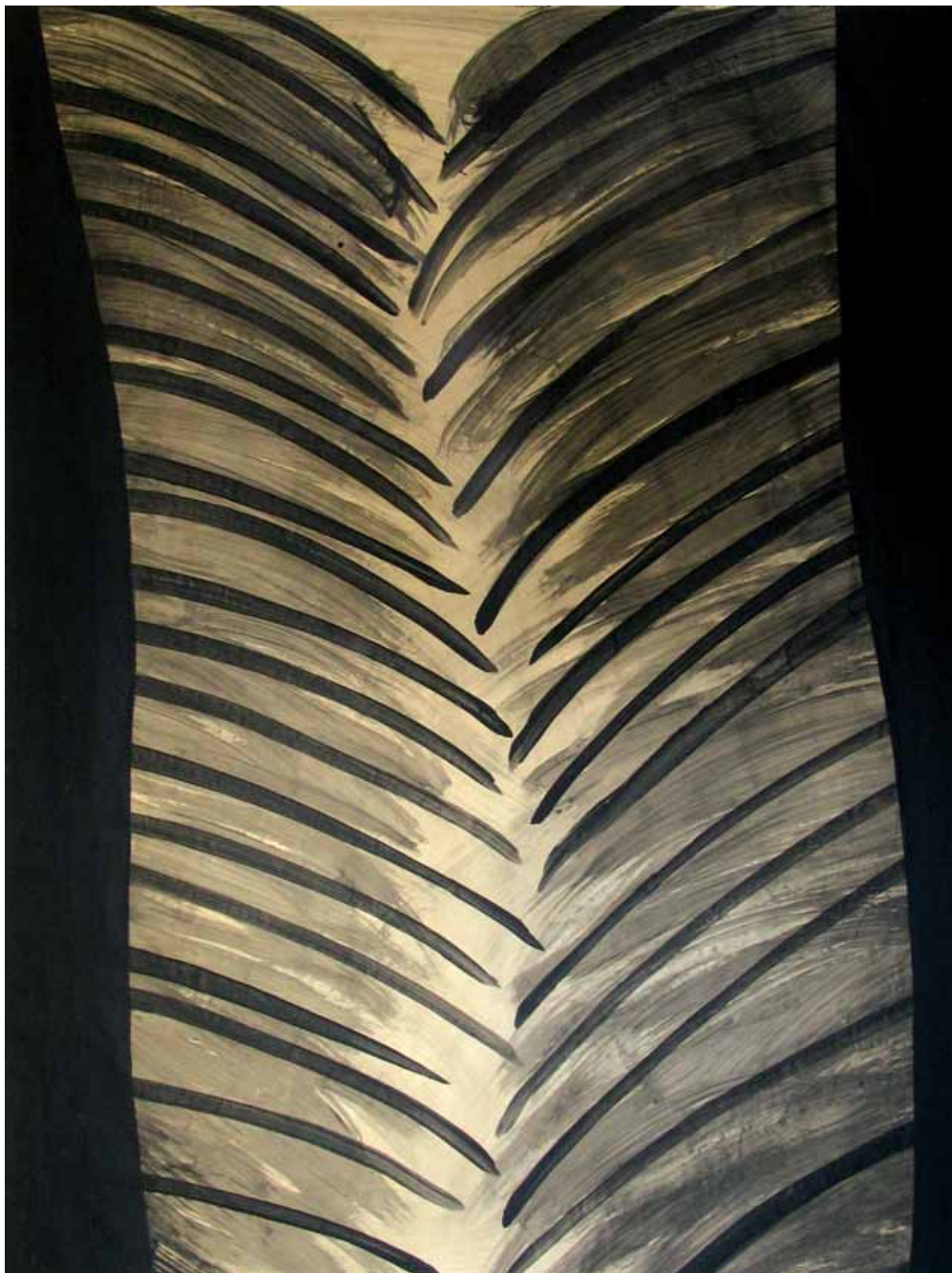
„Czerń II”, czarny pigment na papierze, 200 x 147 cm., 2008