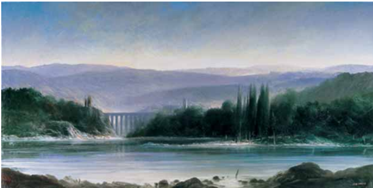
„Widok o świcie”, olej na płótnie, 100 x 200 cm., 2001