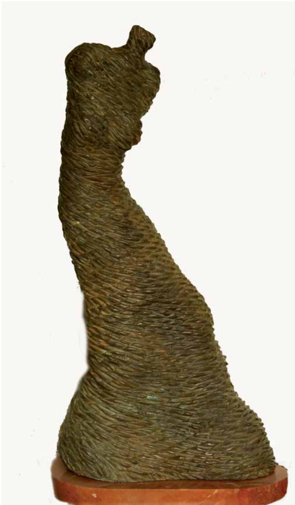
„Nicobecna”, brąz, 56 x 34 cm., 2008