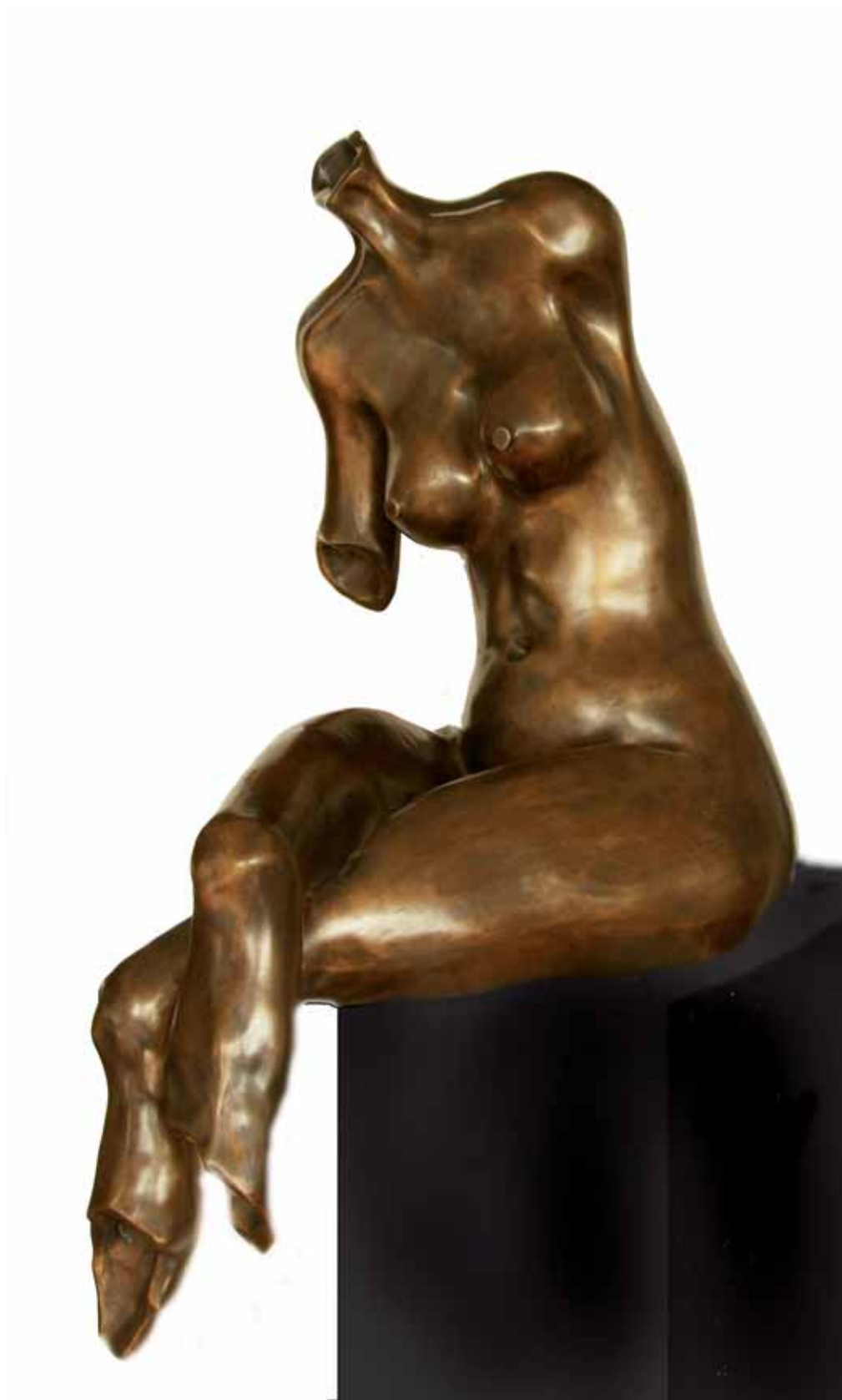
„Nicobecna”, brąz, 56 x 34 cm., 2008