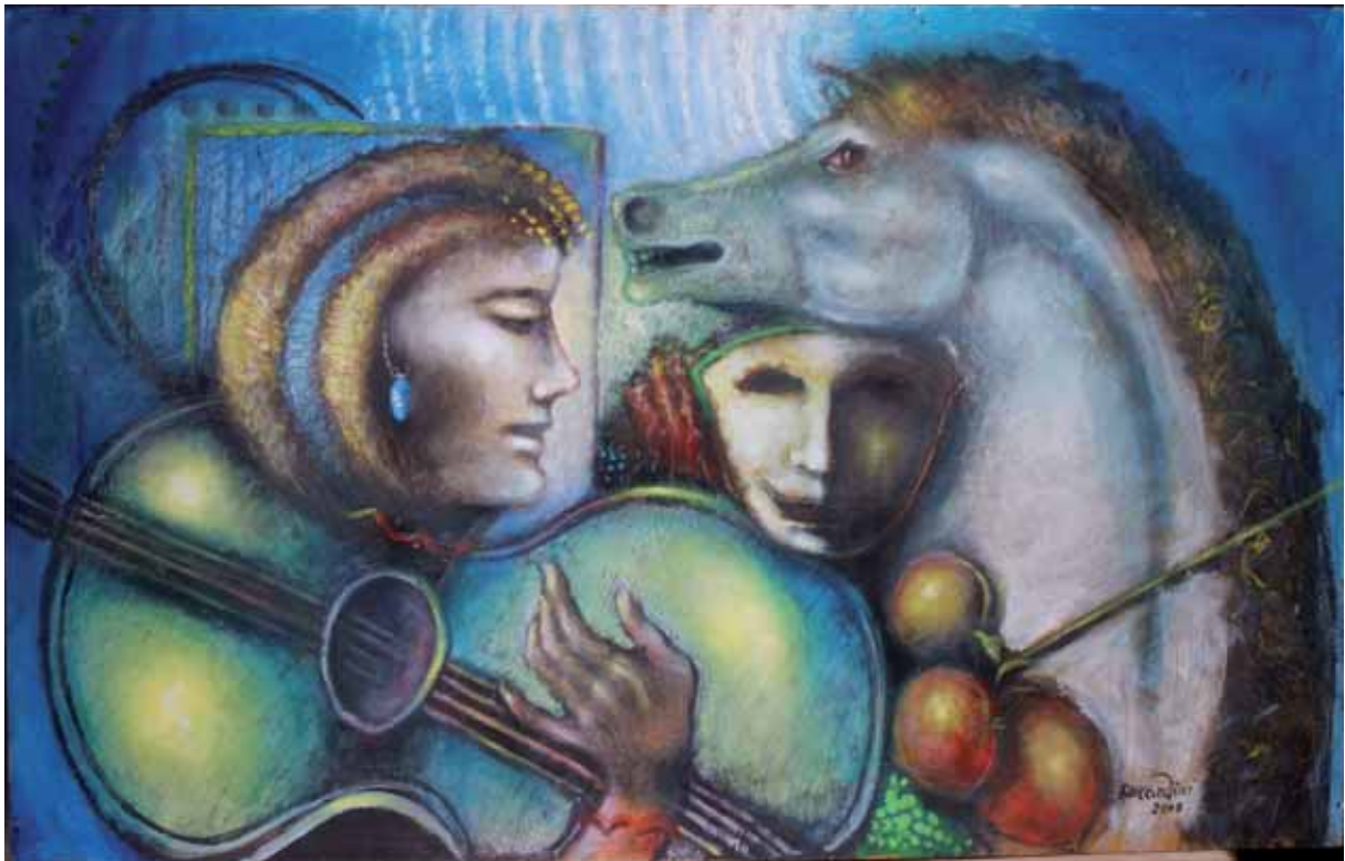
„Serenada w starym miasteczku”, technika mieszana, 105 x 165 cm., 2008