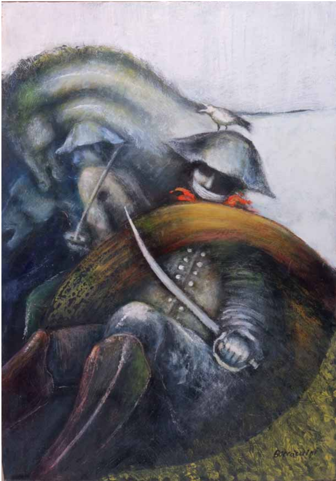
„Waterloo”, technika mieszana, 100 x 70 cm., 2008