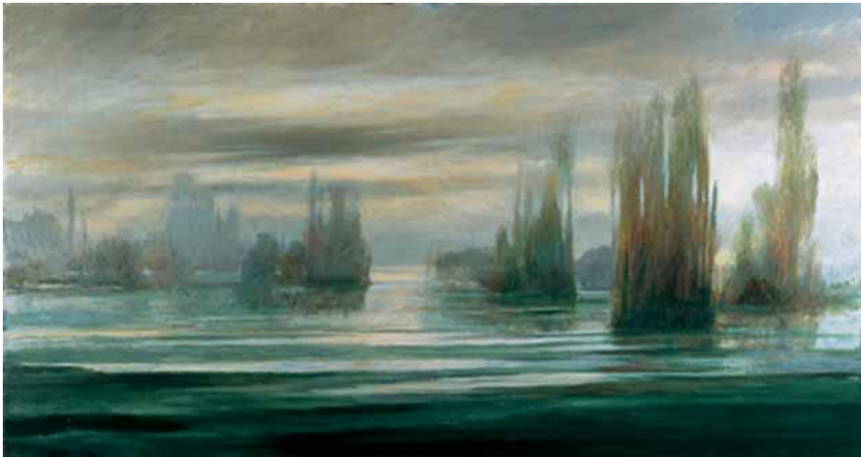
„Odbicia”, olej na płótnie, 120 x 300 cm., 2000