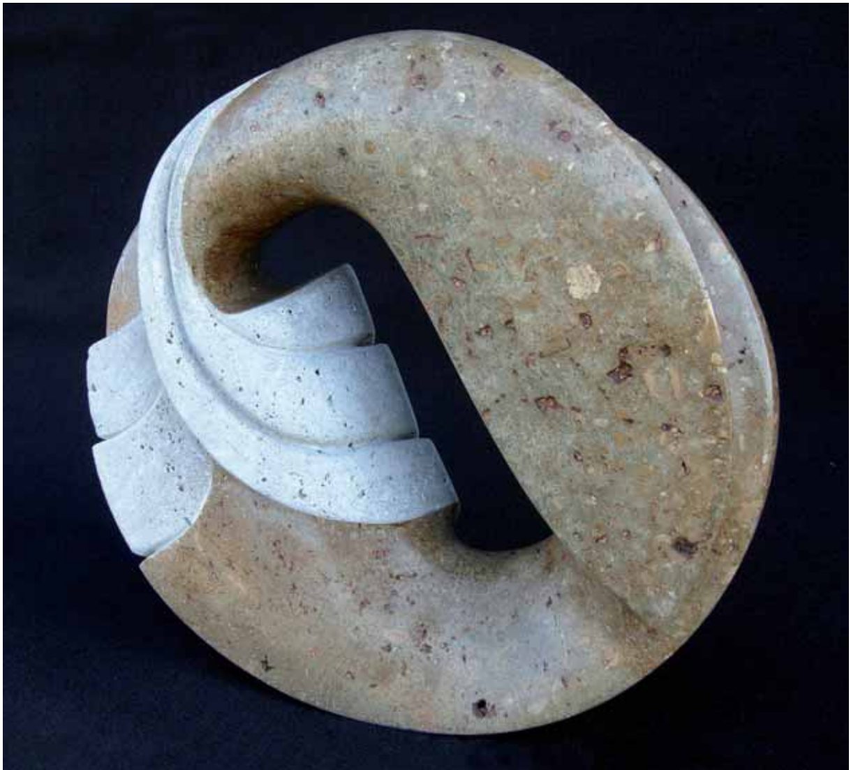
„Podmuch wiatru”, trawertyn noce, 40 x 15 cm., 2007