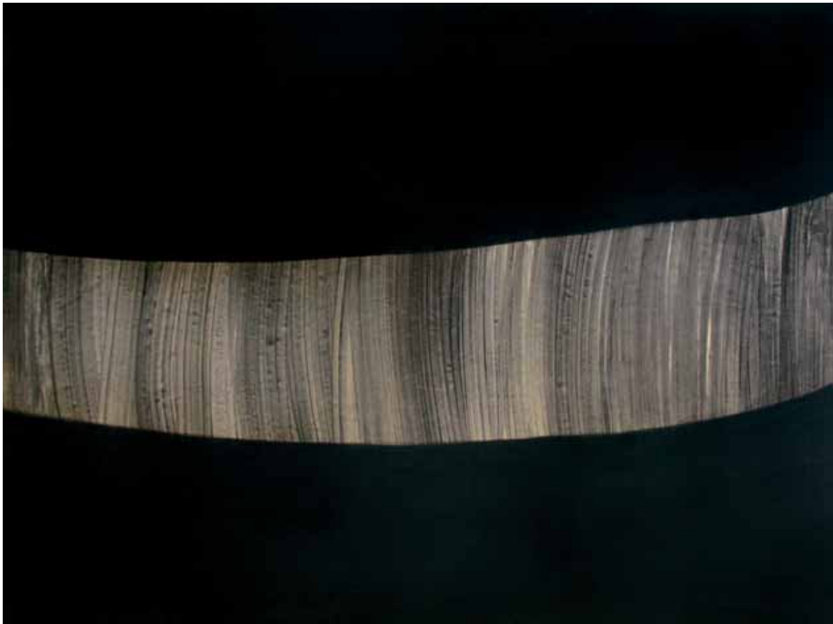
„Czerń III”, czarny pigment na papierze, 147 x 200 cm., 2008