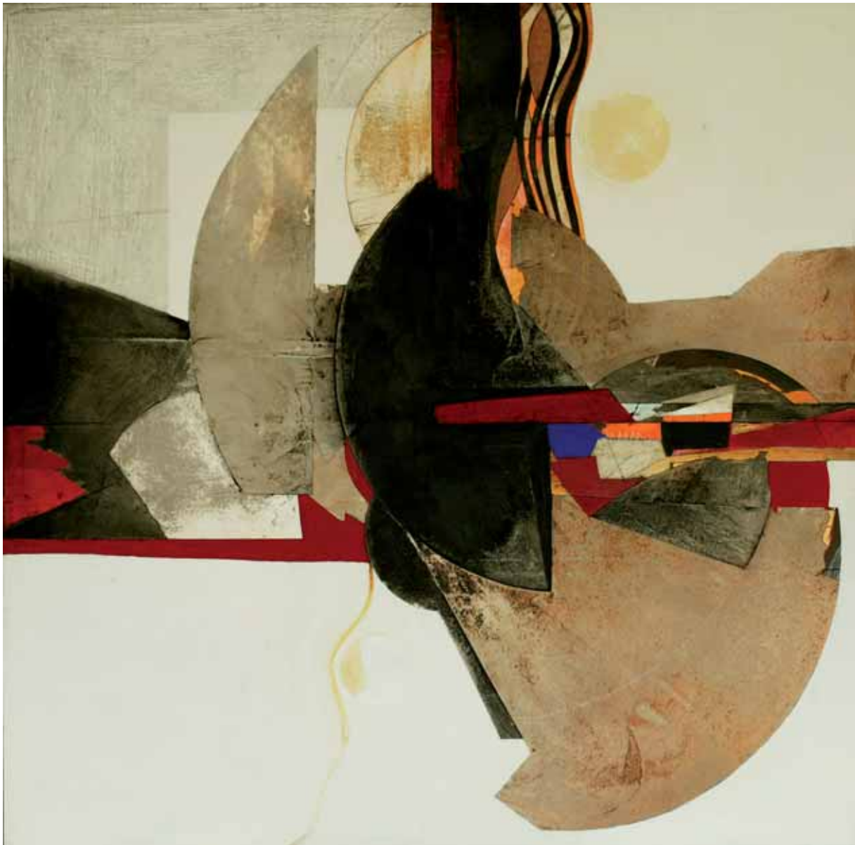
Bez tytułu, technika mieszana na sklejkę, 135 x 135 cm., 2008