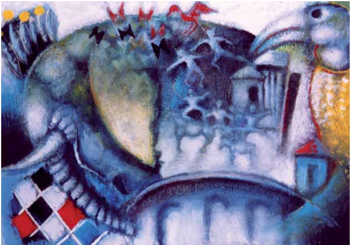
„Księga dżungli”, technika mieszana, 50 x 60 cm., 2006