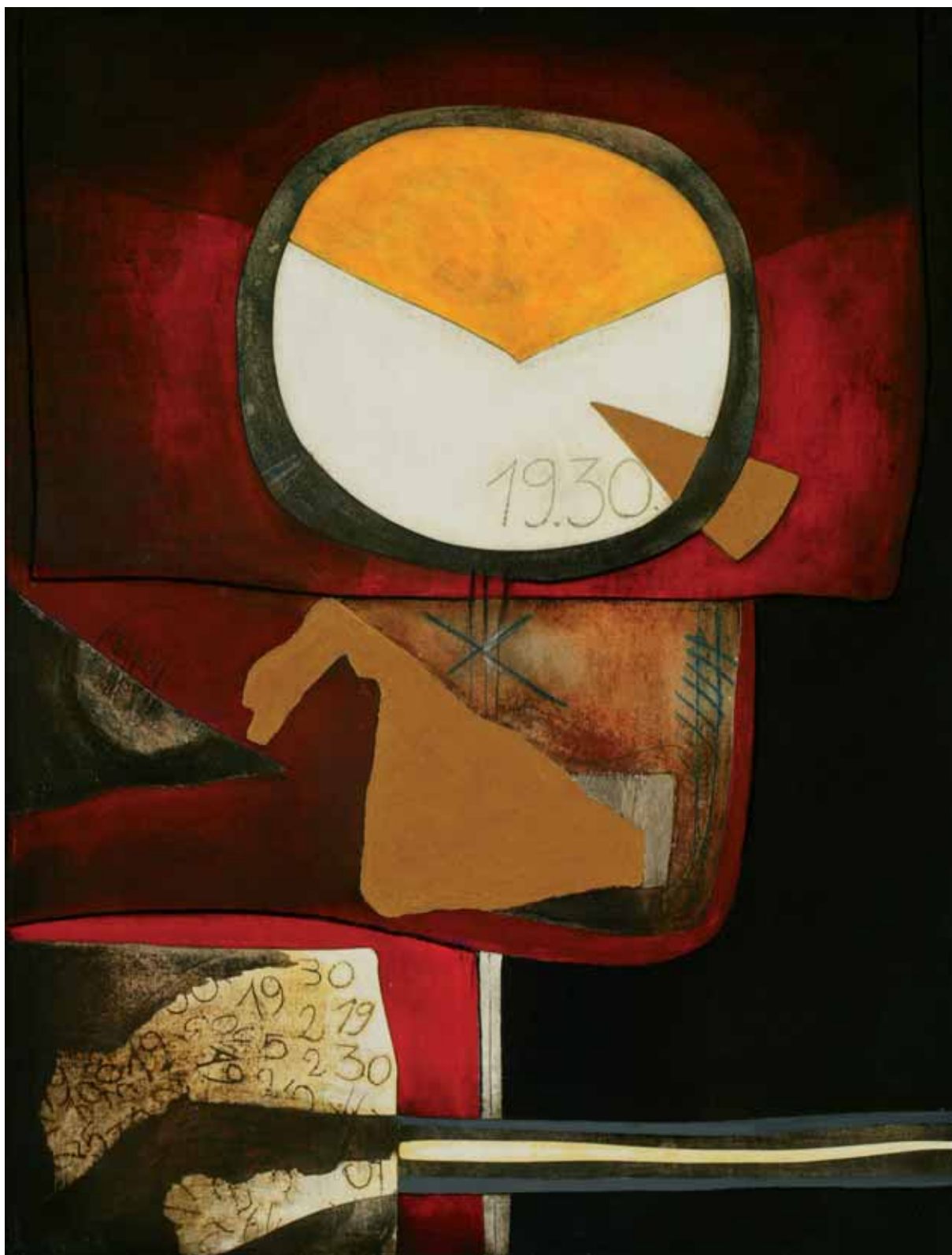
Bez tytułu, technika mieszana na sklejkę, 165 x 120 cm., 2006