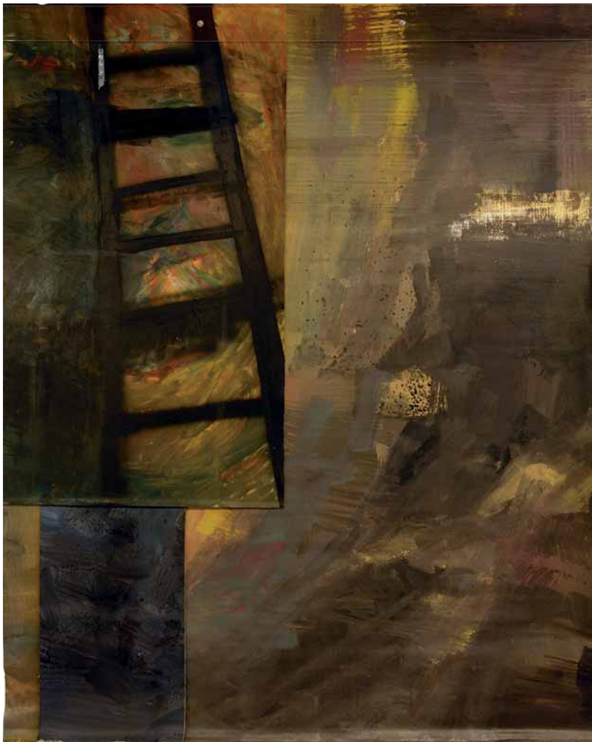
“Szmaty N° 2”, emalia na płótnie, 220 x 167 cm., 2006