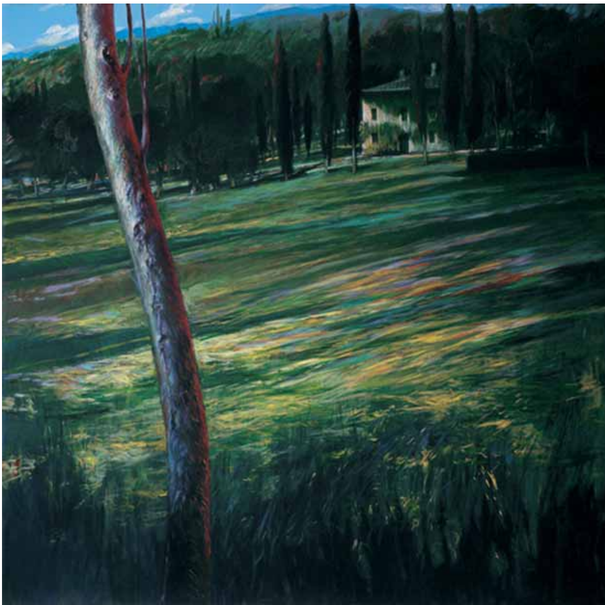
„Willa”, akryl na płótnie, 200 x 200 cm., 1999