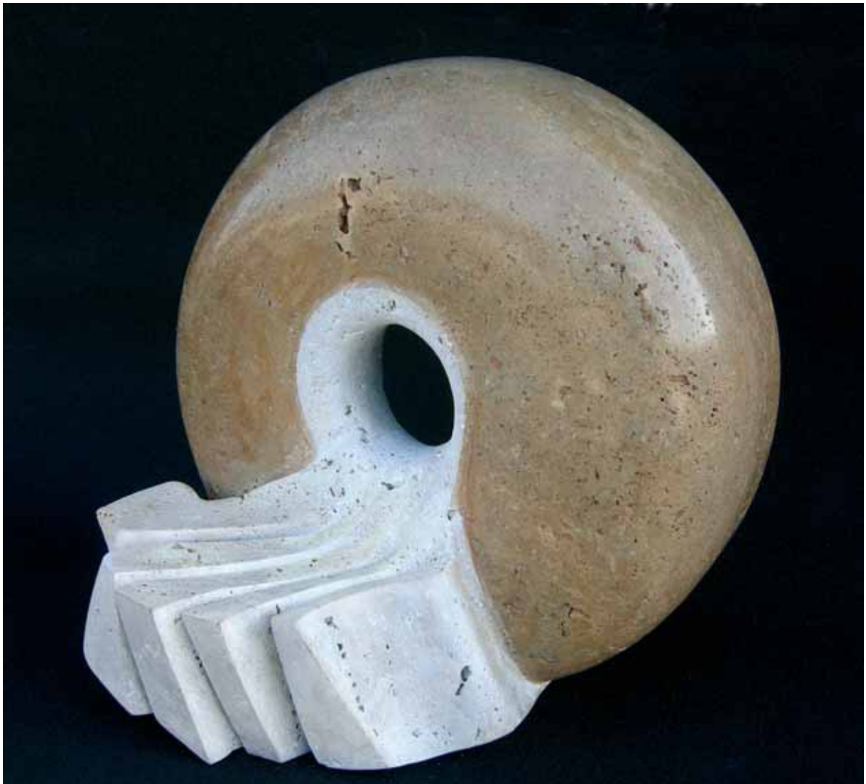
„Echo”, trawertyn, 34 x 24 cm., 2007