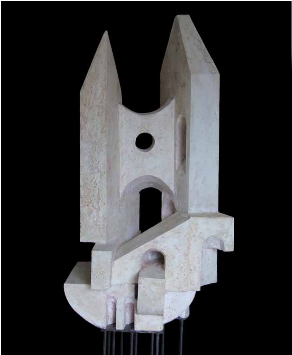
„Przyszła katedra”, gips, 100 x 50 cm., 1997