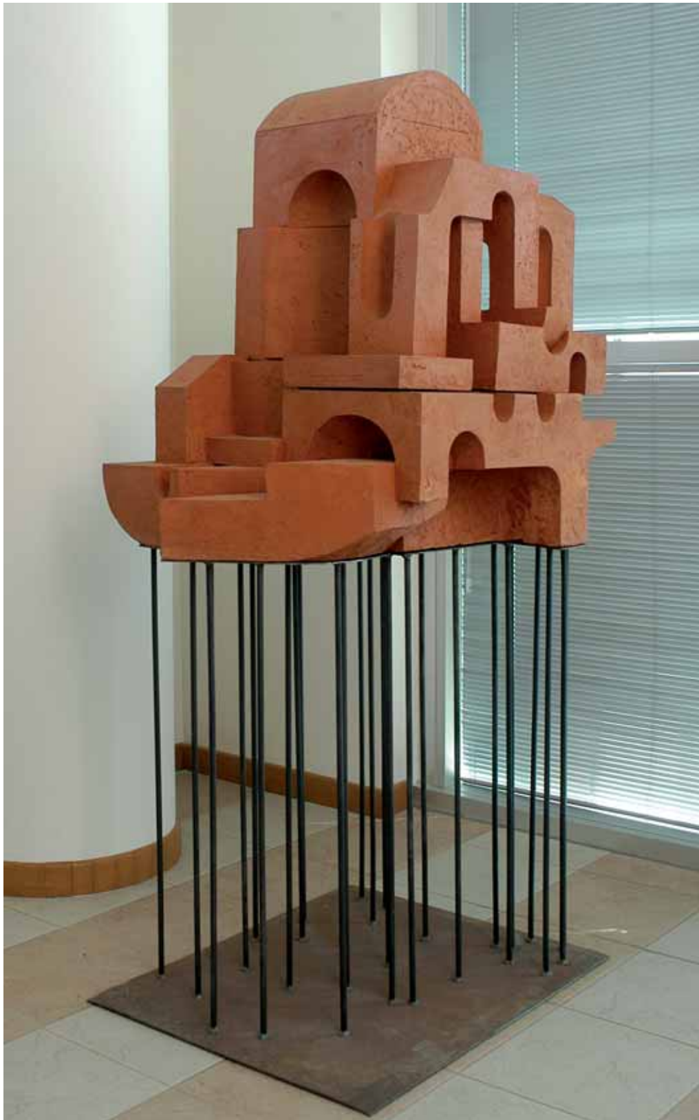
„Kościół z ziemi”, kolorowa glina ogniotrwała, 85 x 80 cm., 1997