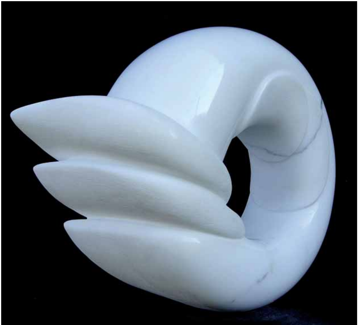
„Wiatry pasatowe”, marmur statuario, 35 x 20 cm., 2007