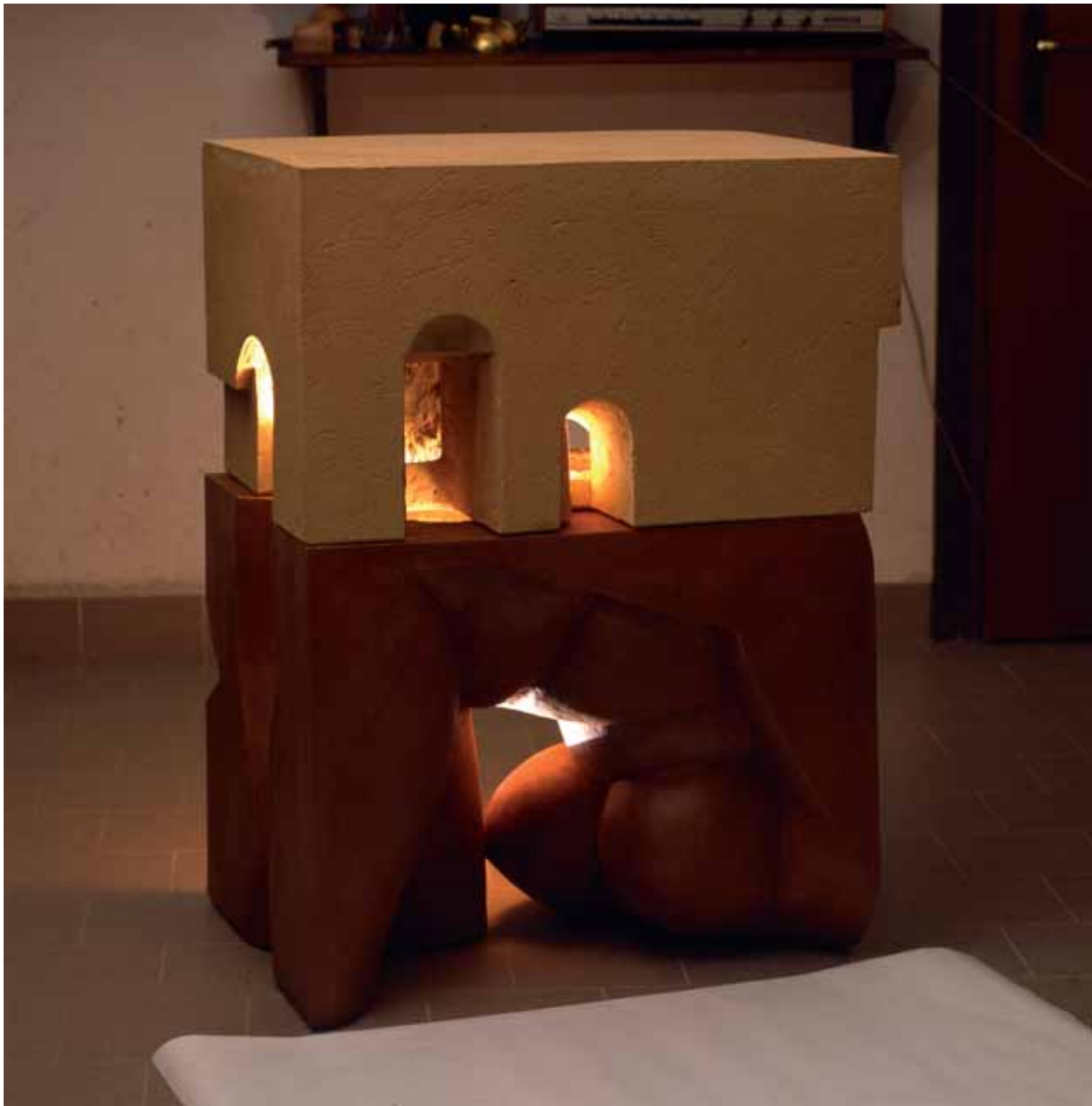
„Matka”, kolorowa glina ogniotrwała, 95 x 70 x 51 cm., 1993