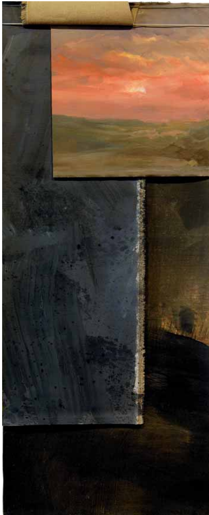
„Szmaty N° 7”, emalia na płótnie, 150 x 60 cm., 2006