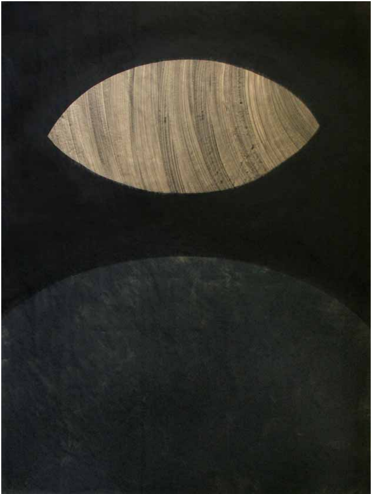
„Czerń IV”, czarny pigment na papierze, 200 x 147 cm., 2008