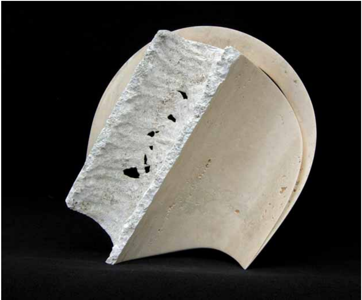
„Uskrzydleni”, relief, trawertyn, 16 x 56 cm., 2007