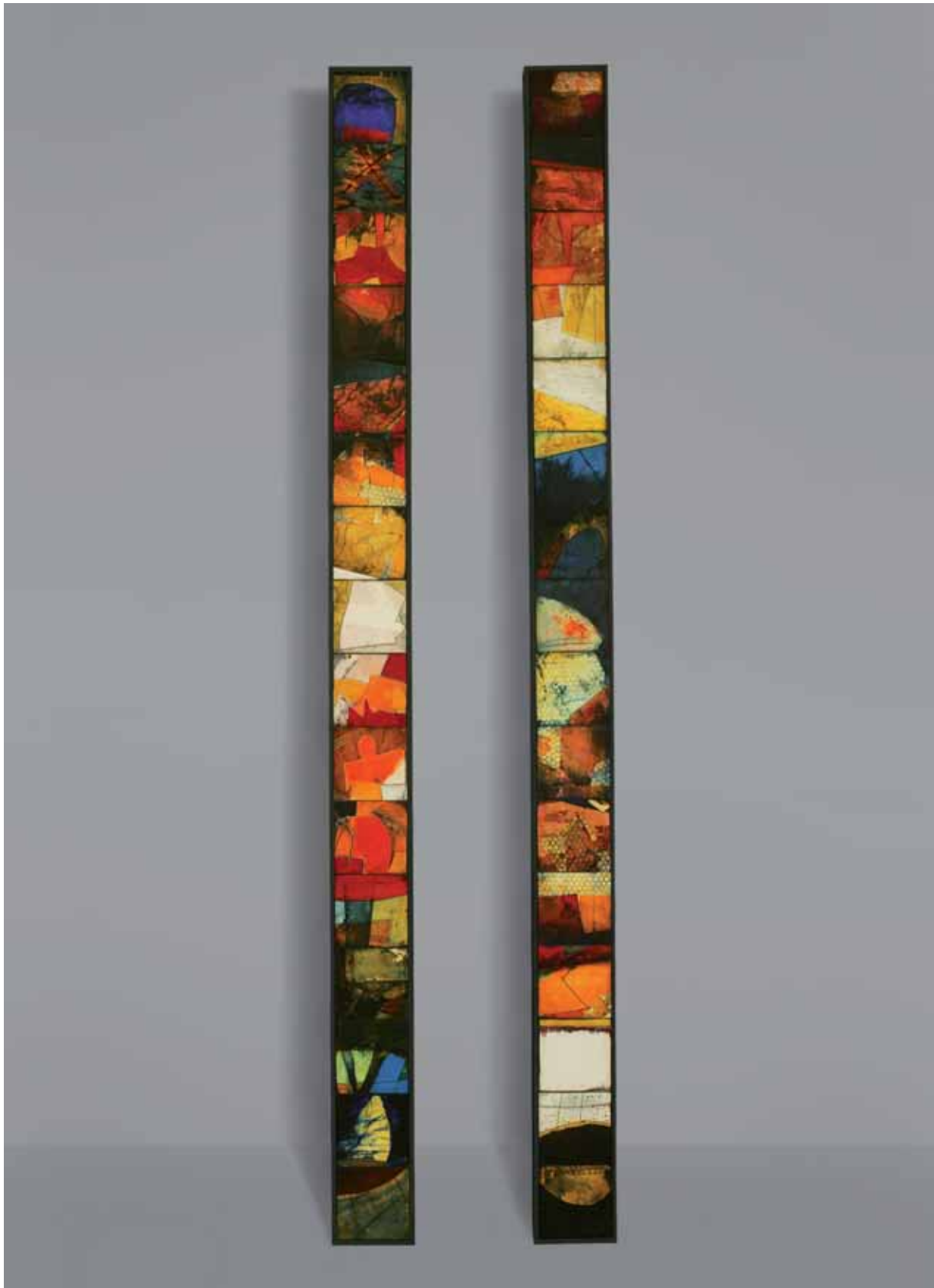
Bez tytułu, technika mieszana na klejce, 180 x 15 cm., 2008