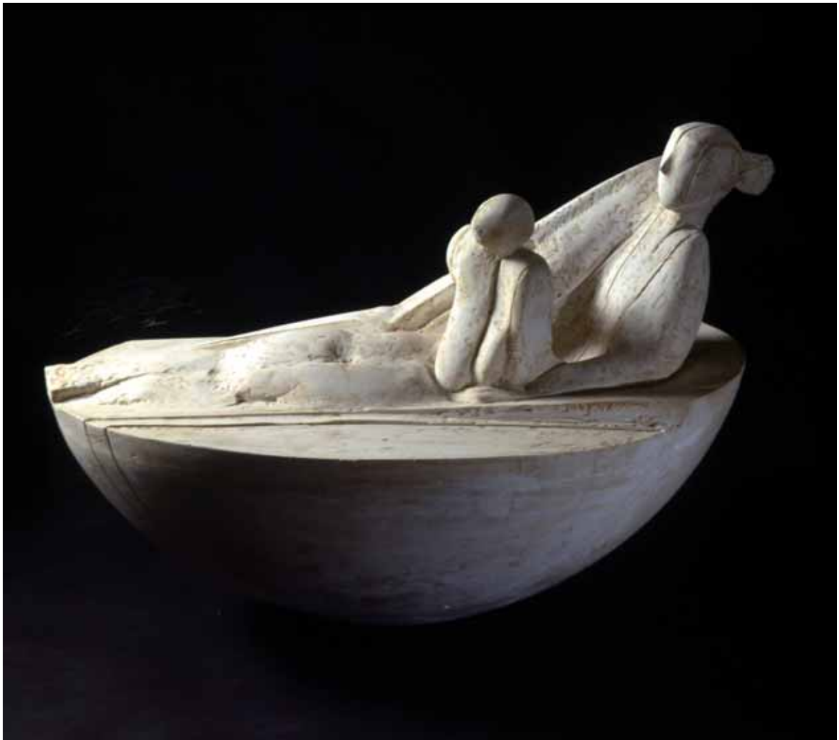
„Obok matki”, gips, diam. 77 cm., 1996