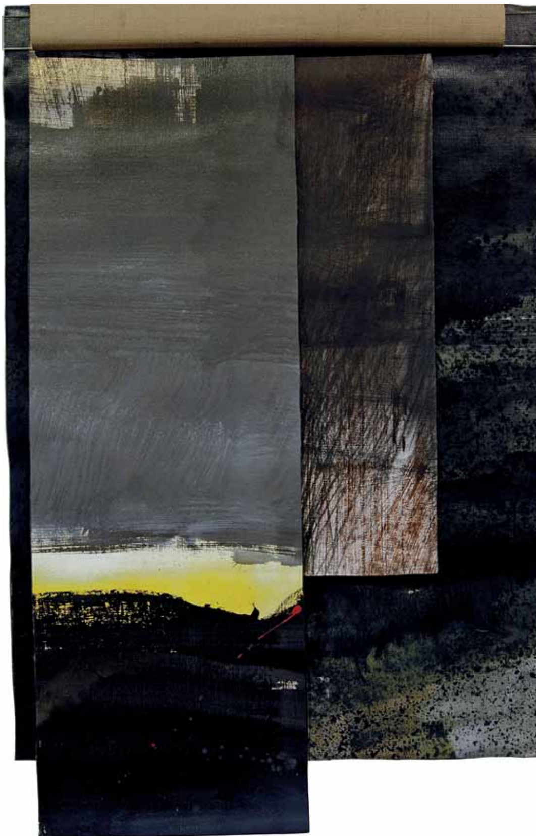
„Szymaty N° 8”, emalia na płótnie, 124 x 80 cm., 2006