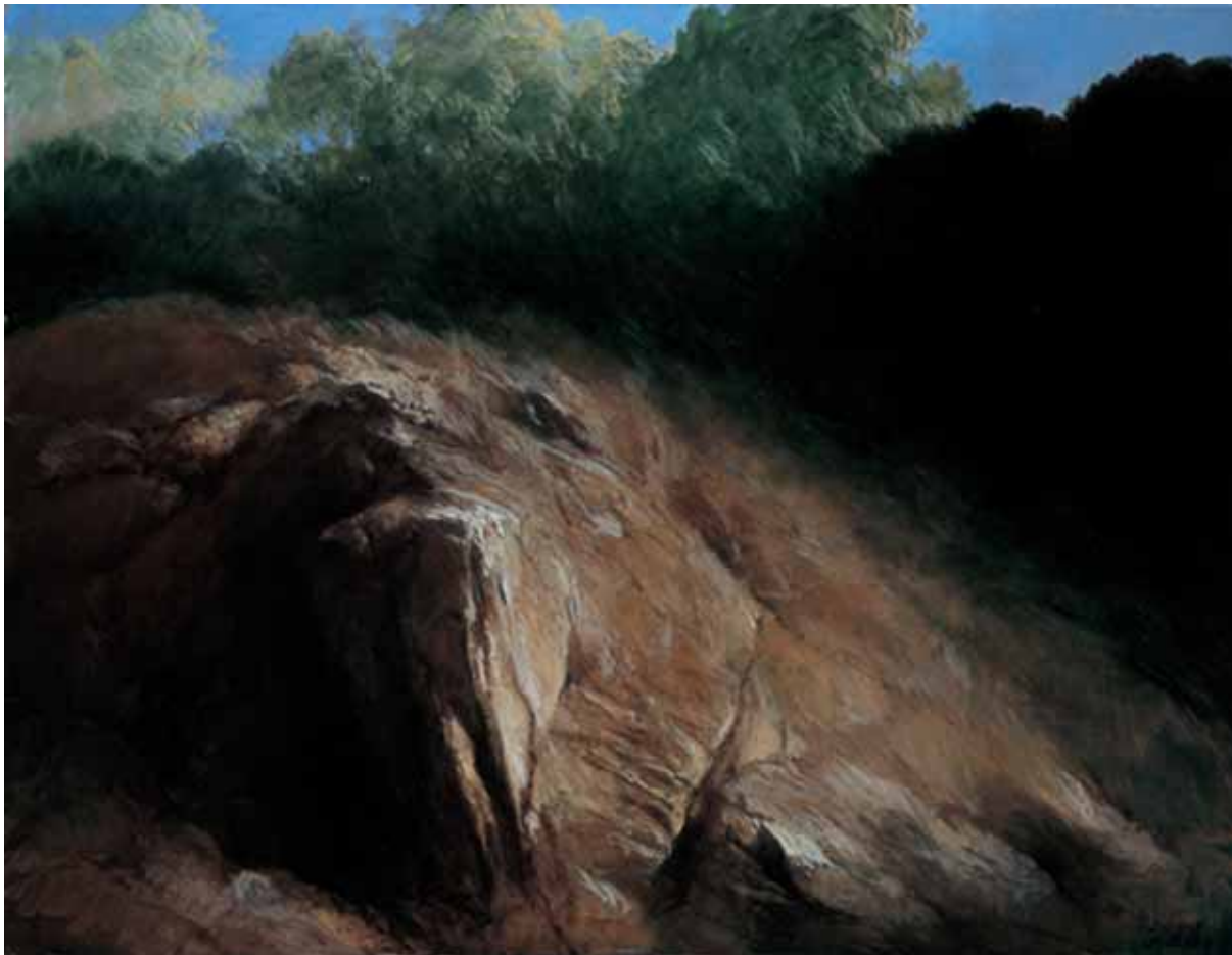
„Wielka skała podwodna”, olej na płótnie, 140 x 190 cm., 1999