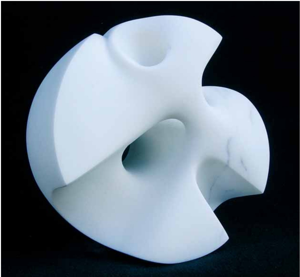
„Erozja”, marmur posagowy, 35 x 20 cm., 2007