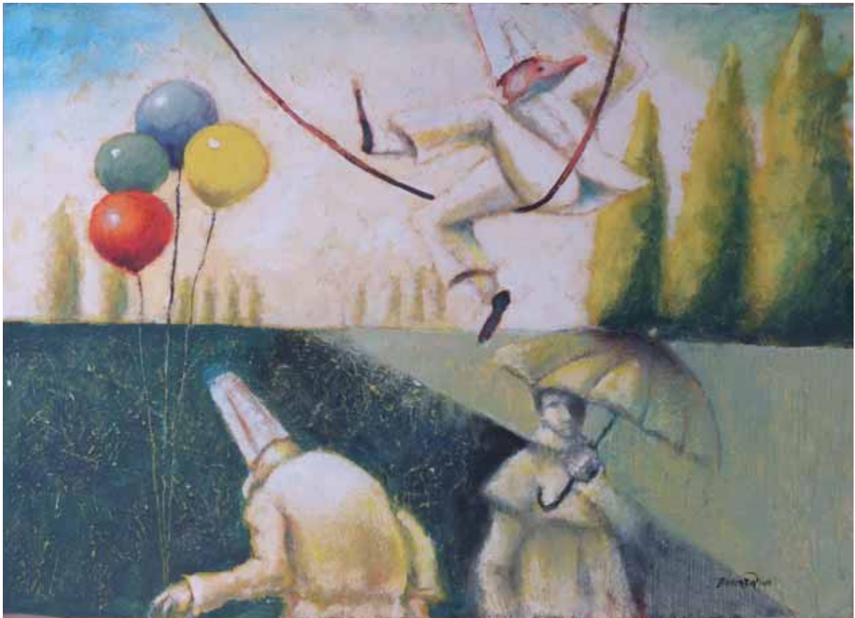
„Huśtawka”, technika mieszana, 70 x 100 cm., 2006