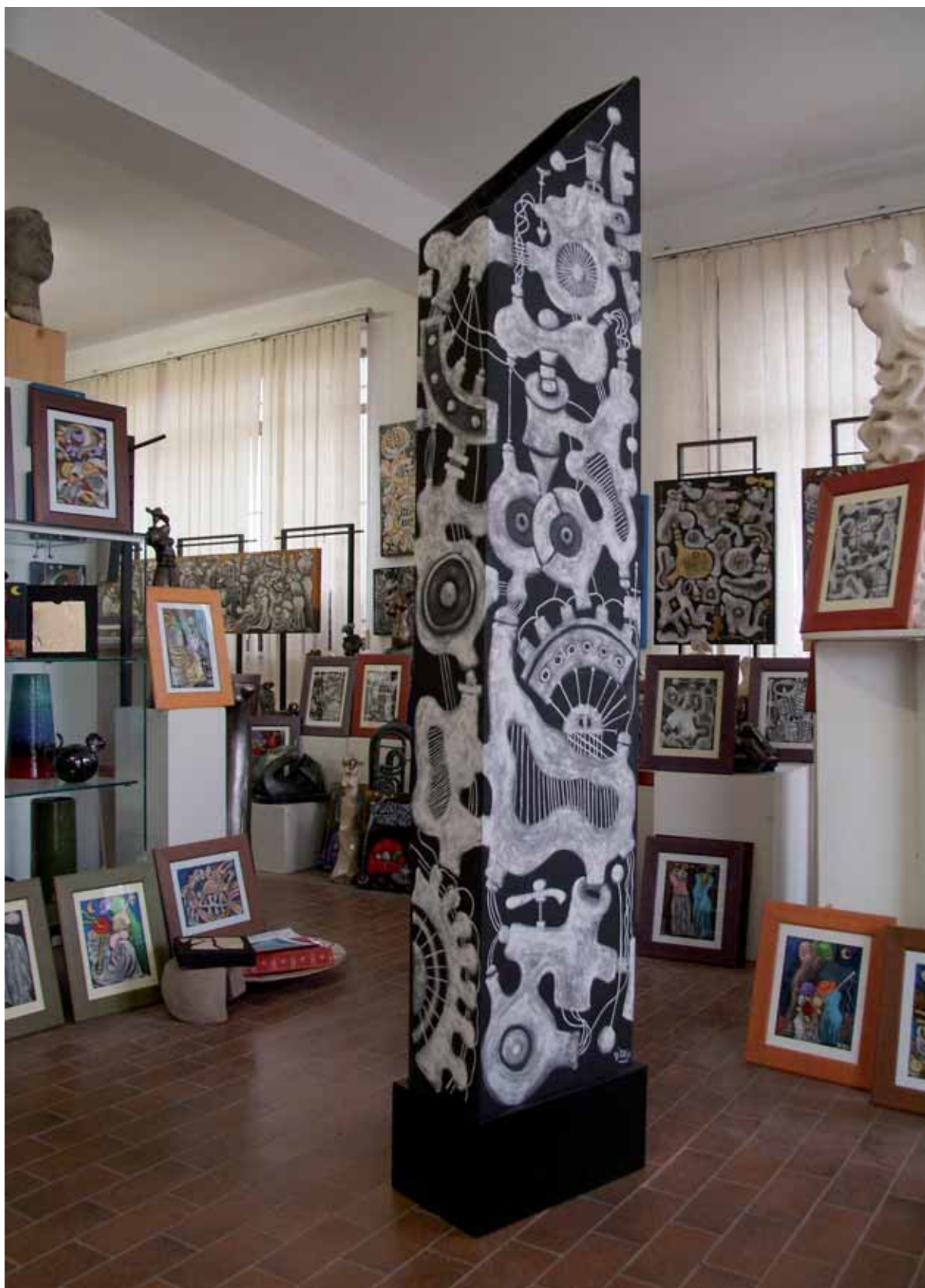
„Obraz-rzeźba – beużyteczne maszyny”, akryl na drewnie, 205x38x20 cm., 2008