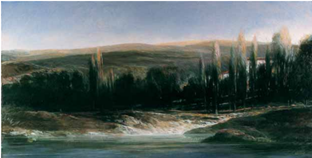
„Szum wody w dnie doliny”, olej na płótnie, 100 x 200 cm., 2003