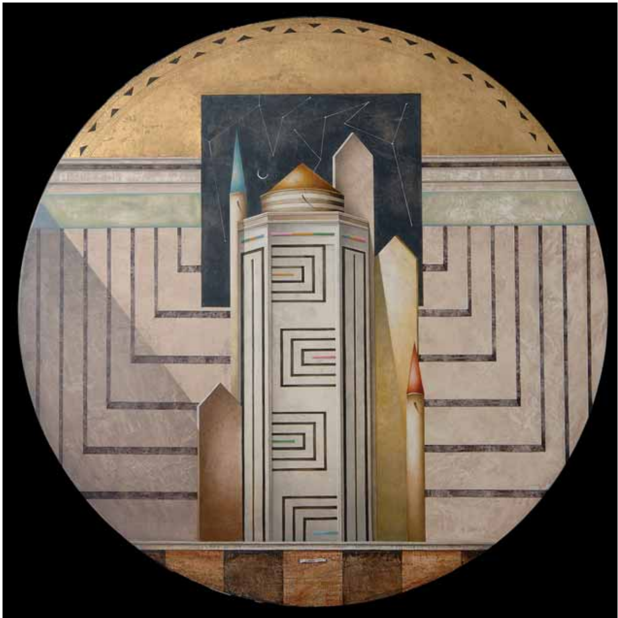
„Samotny poeta”, tempera tłusta i złoto na desce, diam. 150 cm., 2006