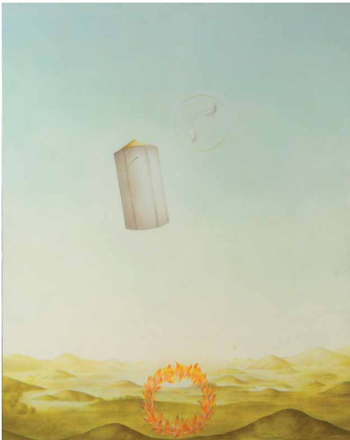
„Objawienie”, tempera tusta na desce, 150 x 120 cm., 2001