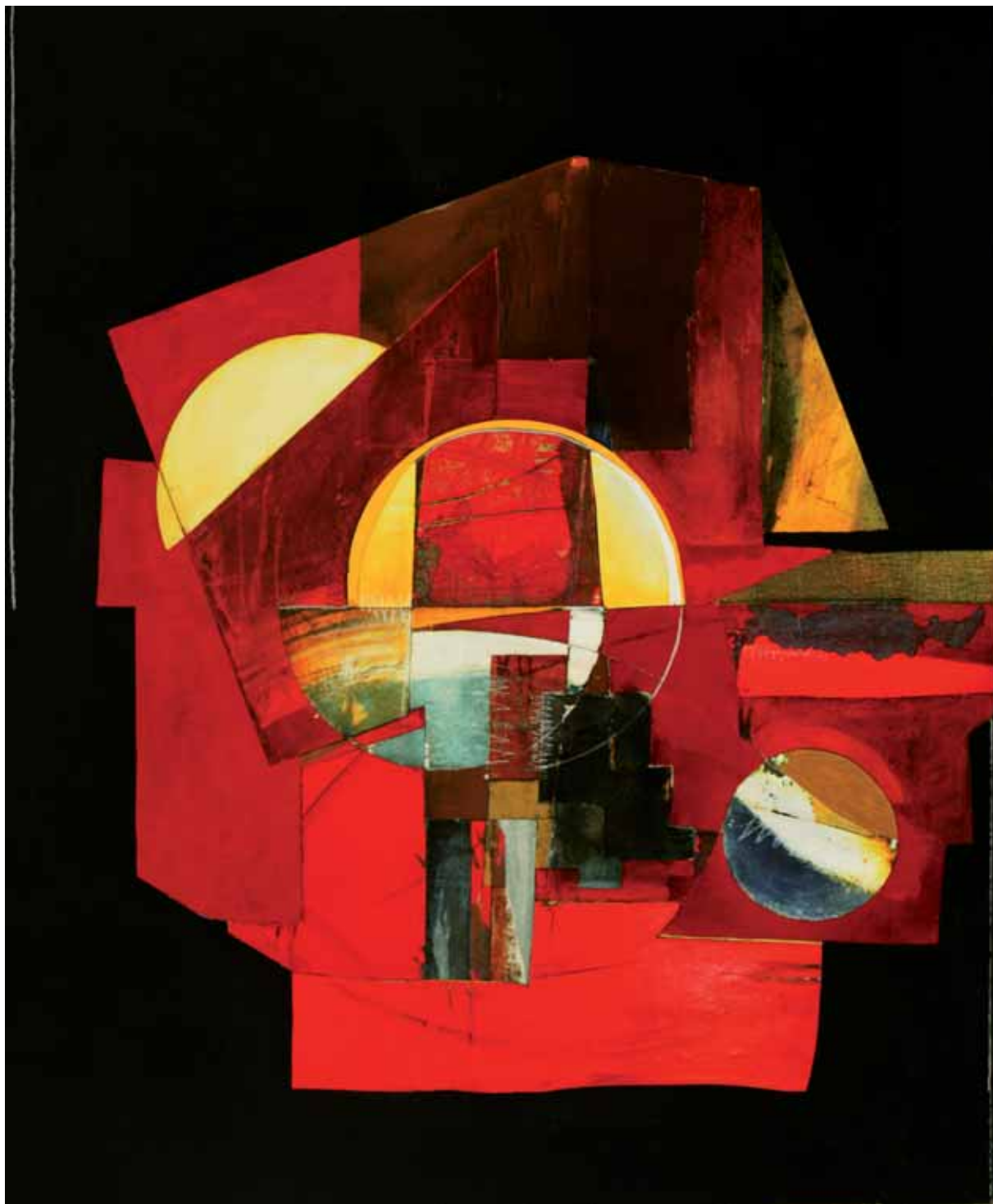
Bez tytułu, technika mieszana na sklejkę, 195 x 150 cm., 2008