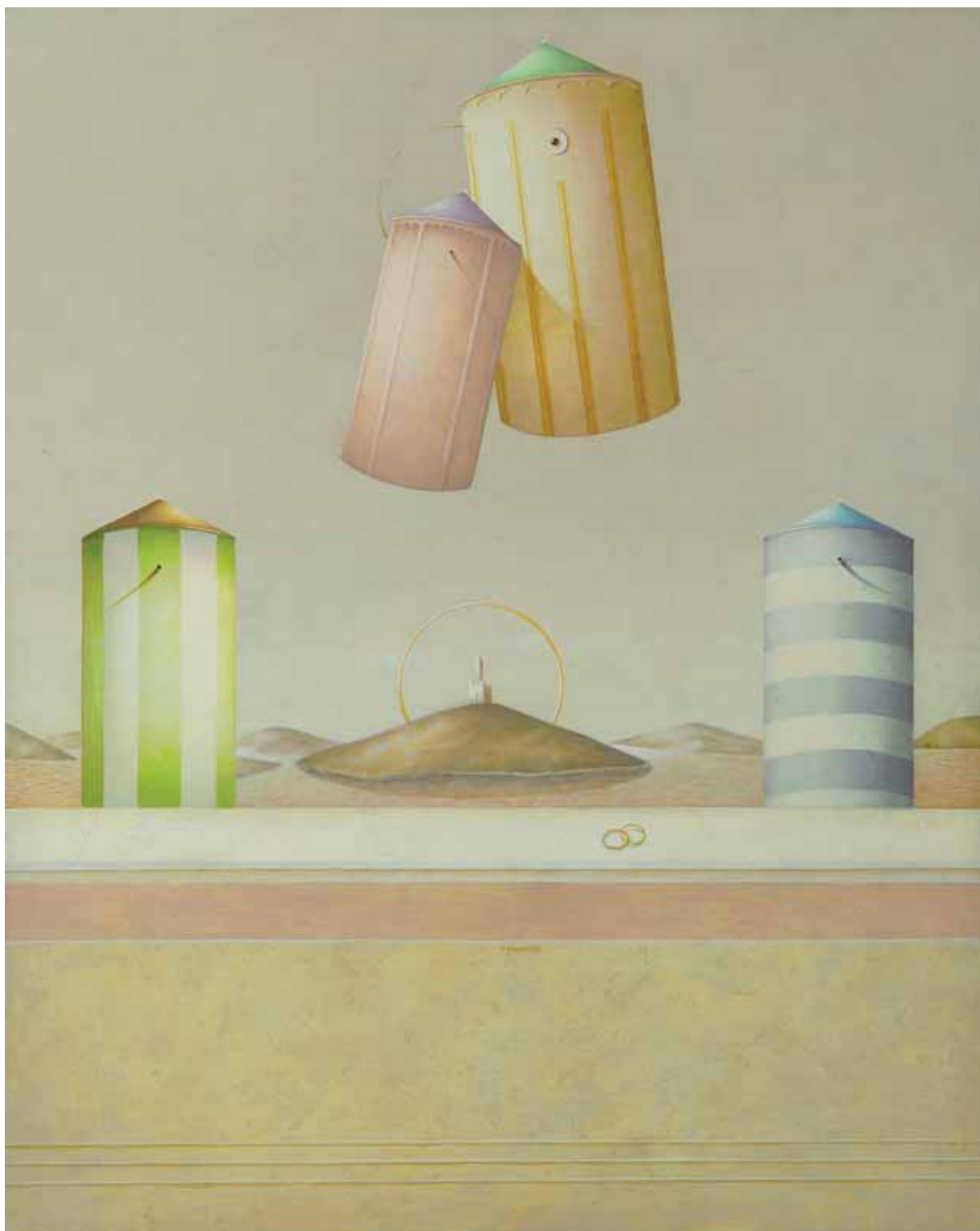
„Mistyczne małżeństwo”, tempera tłusta na desce, 100 x 80 cm., 2001