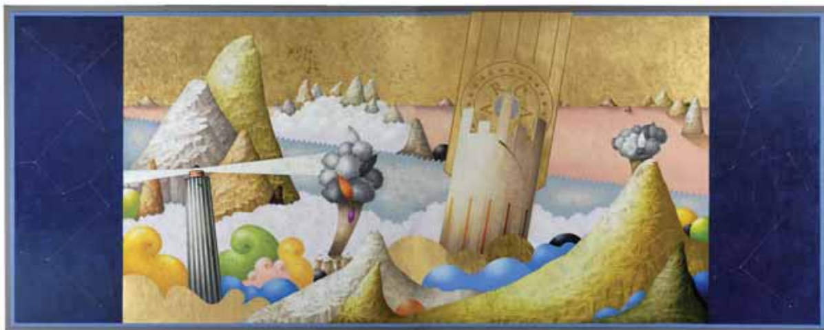
„Arka”, tempera tłusta i złoto na desce, 120 x 300 cm., 2007