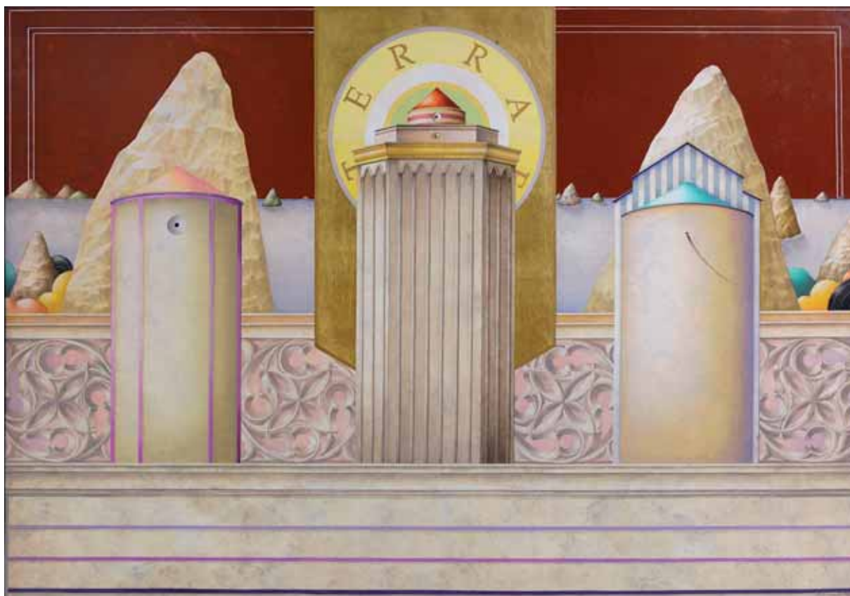
„Terra”, tempera twarda i złoto na desce, 86 x 120 cm., 2006