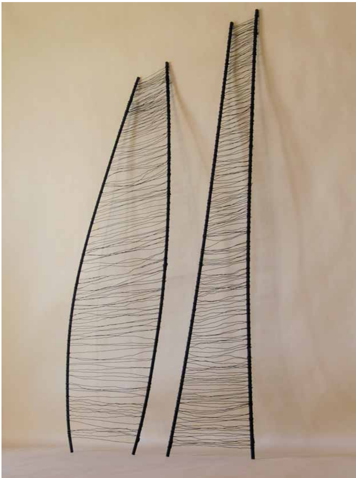
„Rysunek”, rzeźba w żelazie i czarnym pigmentcie, składająca się z dwóch części: 1) wym. 200 x 55 x 15 cm., 2) wym. 200 x 55 x 25 cm., 2008

“Disegno”, scultura in ferro e pigmento nero composta da due pezzi rispettivamente: 1) 200 x 55 x 15 cm., 2) 200 x 55 x 25 cm., 2008